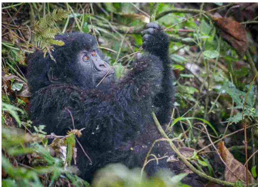
Parco Nazionale dei Vulcani, Kigali (Ruanda)

Per il 60% le esperienze valgono di più dei beni materiali e, secondo Astoi, il 14% in più degli italiani prenota attraverso Agenzia di Viaggi. Tra le mete emergenti per questi esploratori del nuovo millennio ci sono: Ouarzazate , in Marocco, la porta d'ingresso del Sahara, a sud della catena dell'Atlante, Palomino , in Colombia, che oltre alle spiagge caraibiche, offre buona cucina ed escursioni nella natura incontaminata e Kigali , in Ruanda , il paese delle mille colline, oggi più accessibile per osservare i gorilla di montagna che vivono nel Parco Nazionale dei Vulcani .