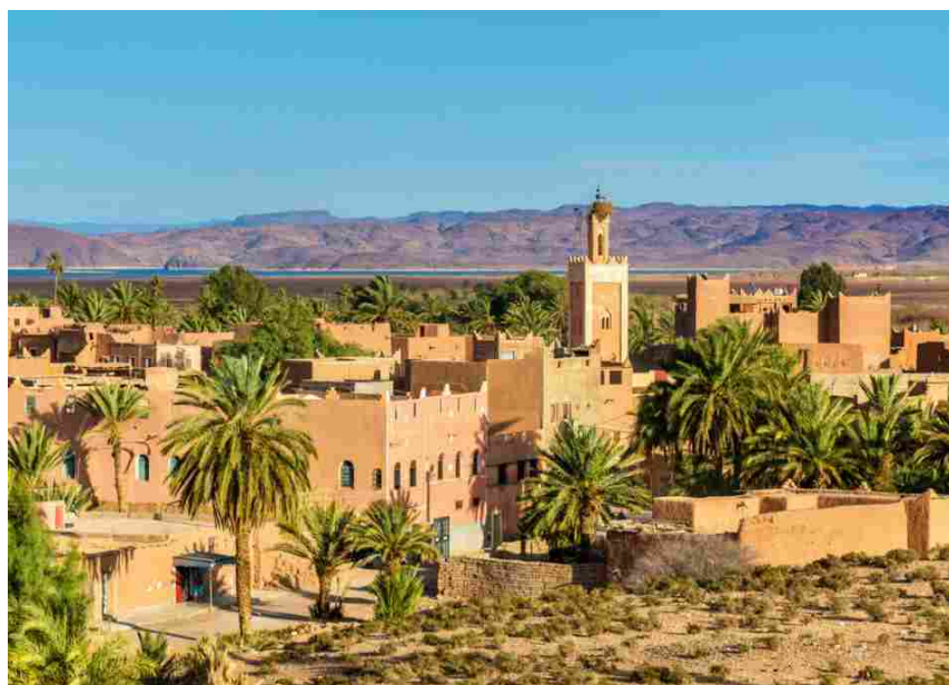
Ouarzazate, Marocco