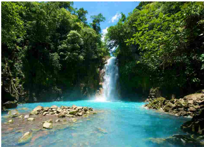
Costa Rica

dei Caraibi. Il Costa Rica fa parte delle destinazioni trendy per Traveller Made , Luxury Travel Designer Community, e in particolare per vivere un'esperienza unica nella foresta pluviale c'è l' ecolodge Rios Tropicales dove la sostenibilità non è una moda ma uno stile di vita. Dalle graduatorie stilate in base a indagini realizzate sulla piattaforma Volagratis.com è forte la ripresa della Turchia (+100%): Paese che ha ritrovato la tranquillità e che è in grado di offrire la grandiosità di Instambul, che fu capitale di tre imperi, il mare dell'Egeo e del Mediterraneo e tutta la bellezza dei pinnacoli rocciosi della Cappadocia.